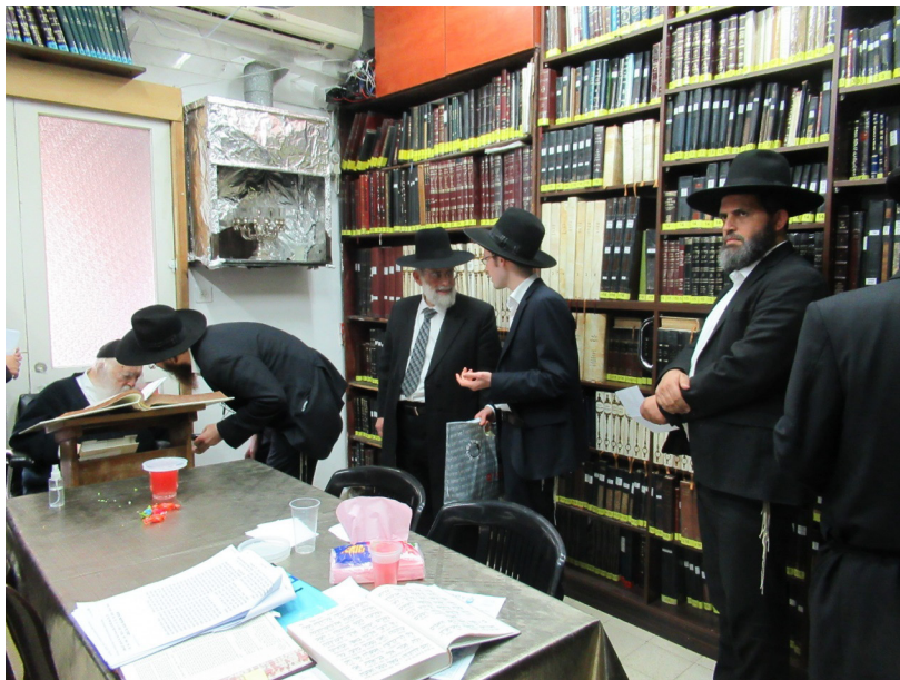
"עצות חינוכיות ממה שהשיב בעתות קבלת קהל". מראה קבלת קהל אופייני באחד הימים בבית רבינו שליט"א.

מובן, כי אין בכוחנו ליכנס לכל נושא לגופו, אך כן יש באפשרותנו להביא מבט כללי של דעת - תורה מרבינו שליט"א איך יש לנהוג במצבים דומים, וכיצד נוהג הוא בעצמו.