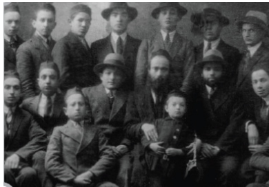
את יסודות החינוך נוחל האדם מסביבתו ורבותיו. דמות דיקונו של רבינו בילדותו, על ברכי אביו מרן ז"ע (מספר 'הרבנית')

הכללי ניתן לחלק לשנים: החלק אותו רואה ומקבל האב/המחנך מסביבתו, מהמקום בו גדל, מהרבים מהם קיבל, שזה בחינה של מסורת העוברת בכל קהילה, ויש חינוך שהוא תגובה נכונה הנצרכת לאותו הפרט, ולשם זה יש להכין כלים וללמוד מהם הכללים.